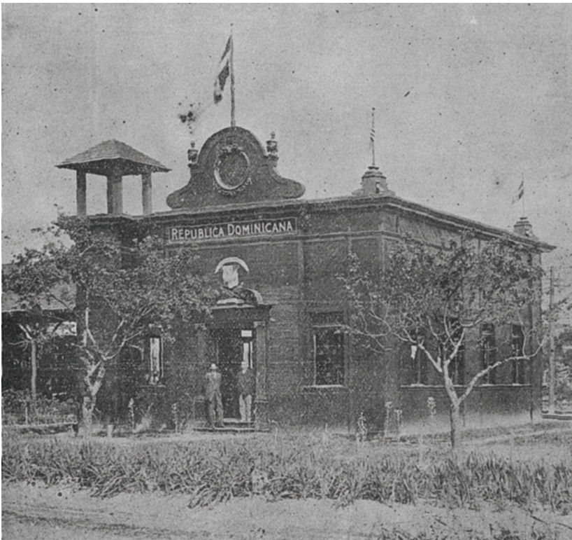
Pabellón dominicano en la exposición de Jamestown.